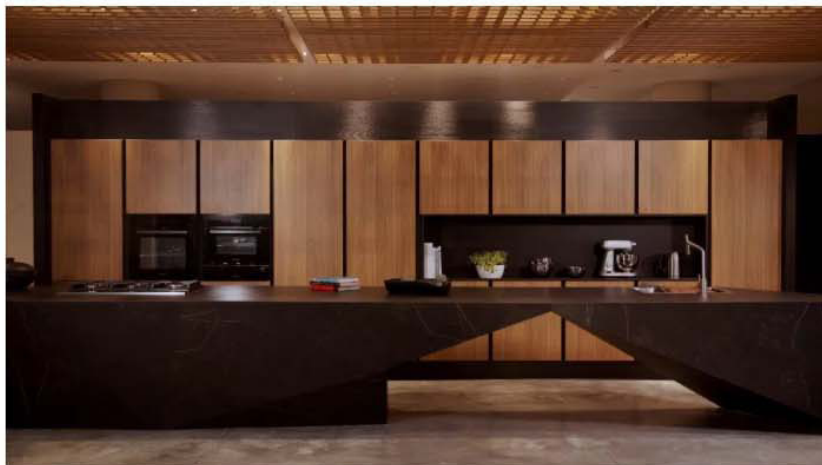
Cozinha Todeschini padrão Leblon nas frentes com sistema Veneza vertical e balcão com frentes slim com Dekton Kelya

Confira uma galeria de elementos para se inspirar como adicionar tons terrosos na decoração: