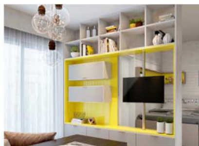
Home Theater Itálinea aposta nas formas quadrangulares