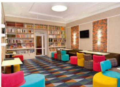
Piso vinílico da Tarkett traz cores e formatos em projeto